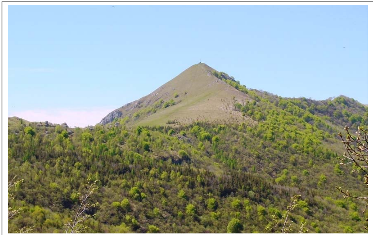
Foto 2. Crinale Monte Rai - Cornizzolo, prateria versante nord (in ZPS)