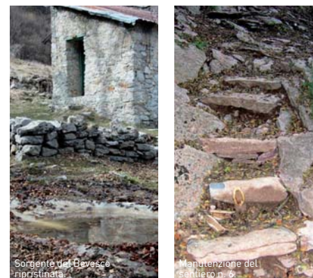
Sorgente del Bevesco ripristinata.