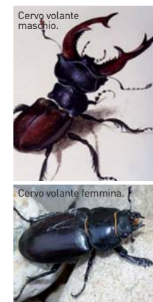
Cervo volante maschio.

Il cervo volante, come altri insetti che vivono nel legno, è una specie in declino. Alberi morti o tronchi marcescenti fungono da fonte di cibo e sito di riproduzione.