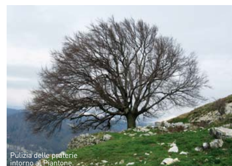
Pulizia delle praterie intorno al Piantone.

Mantenimento delle praterie di crinale mediante decespugliamenti e pascolamenti localizzati intorno al Piantone e nelle zone di margine del bosco; sistemazione di pozze d'abbverata; posa di cassette nido per Avifauna e Chiroterteri; messa in sicurezza e posizionamento al suolo di tronchi marcescenti.