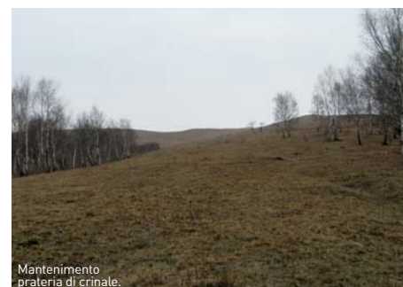
Mantenimento prateria di crinale.