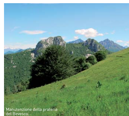
Manutenzione della prateria del Bevesco.