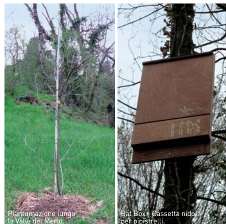
Piantumazione lungo la Valle del Merlo. Bat Box - Cassetta nido per pipistrelli.

Riqualficazione di alcune aree degradate, lungo l'emissario che collega il lago Segrino al lago di Pusiano, mediante riqualficazione e ampliamento di macchie boscate; posa di cassette nido per Avifauna e Chiroterteri; messa in sicurezza e posizionamento al suolo di tronchi