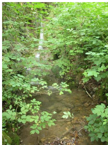
Torrente Cif – stazione 44