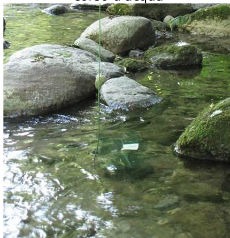
Messa in opera delle nasse per valutare la presenza delle specie alloctone