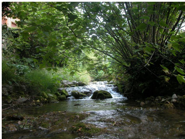
Torrente Culigo – stazione 43