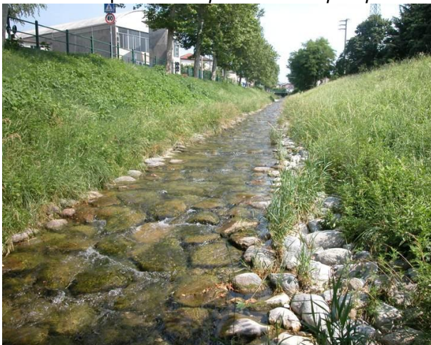
Torrente Gallavesa – stazione 46: corso in ambiente urbanizzato