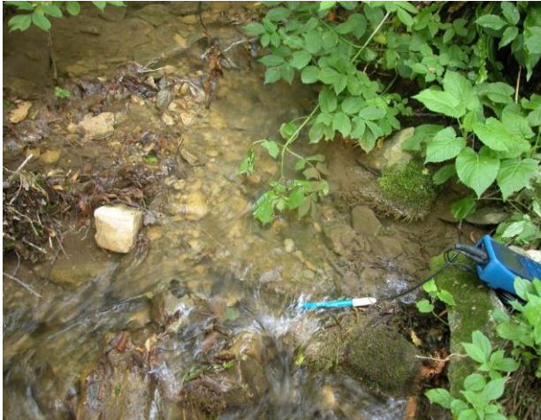
Misurazione in campo del pH