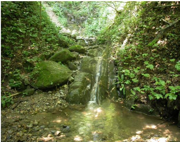
Roggia Madonna – stazione 41