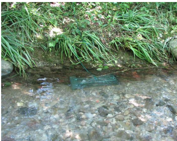
Messa in opera delle nasse per valutare la presenza delle specie alloctone