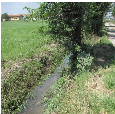
Corso d'acqua inquinato