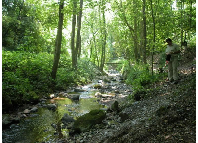
Misurazione del transetto nella Roggia Ruschetta - stazione 42