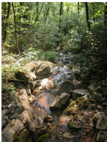
Torrente Ibraula – stazione 45: tipico habitat per Austropotamobius pallipes