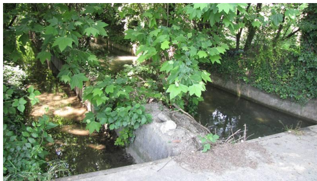
Esempio di canalizzazione e alterazione del corso d'acqua