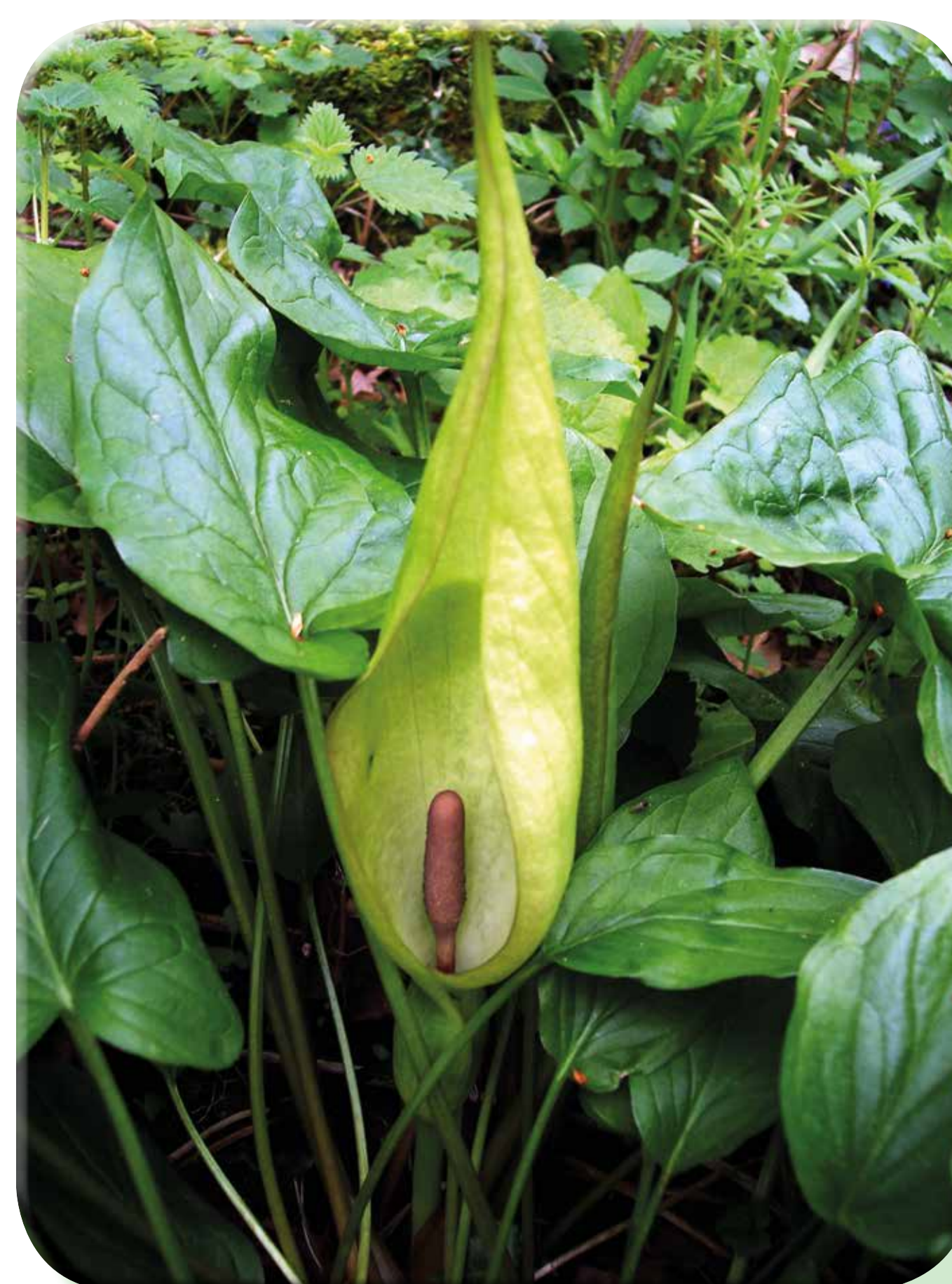
Gigaro scuro