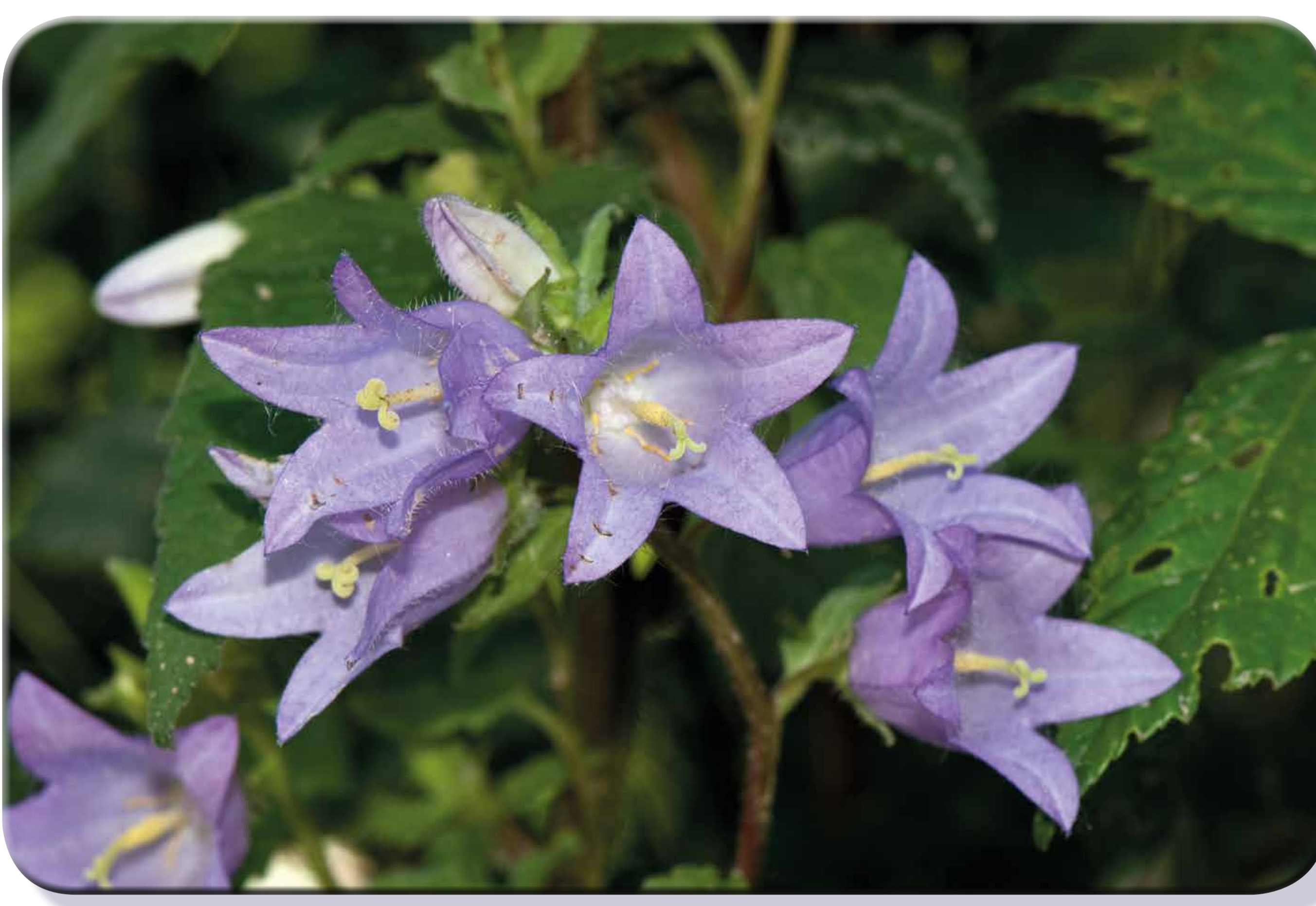
Campanula selvatica