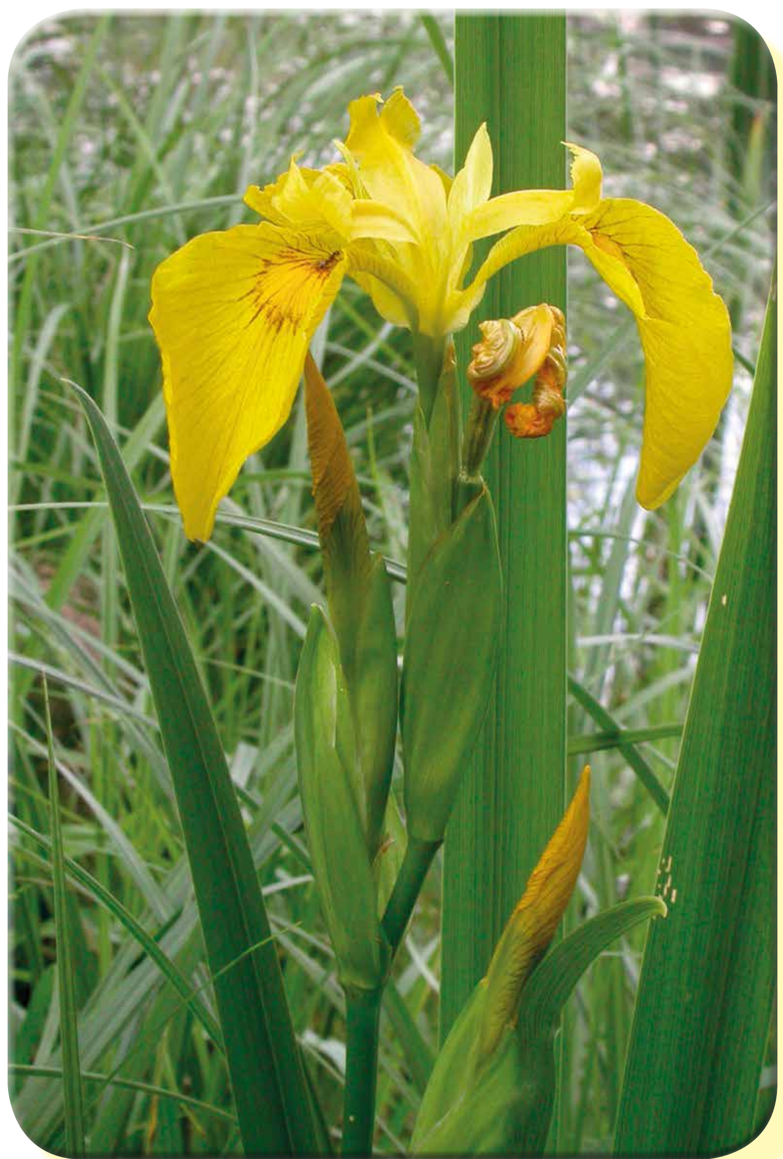
Giaggiolo acquatico