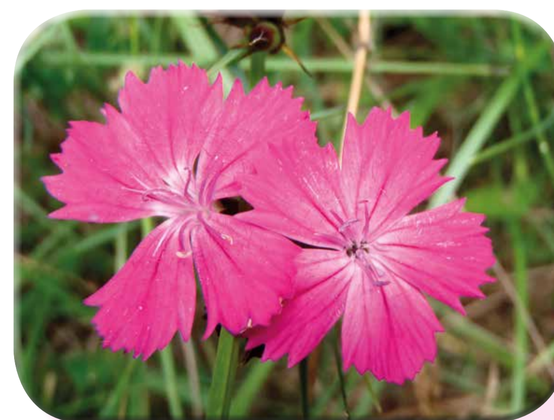
Garofano dei Certosini