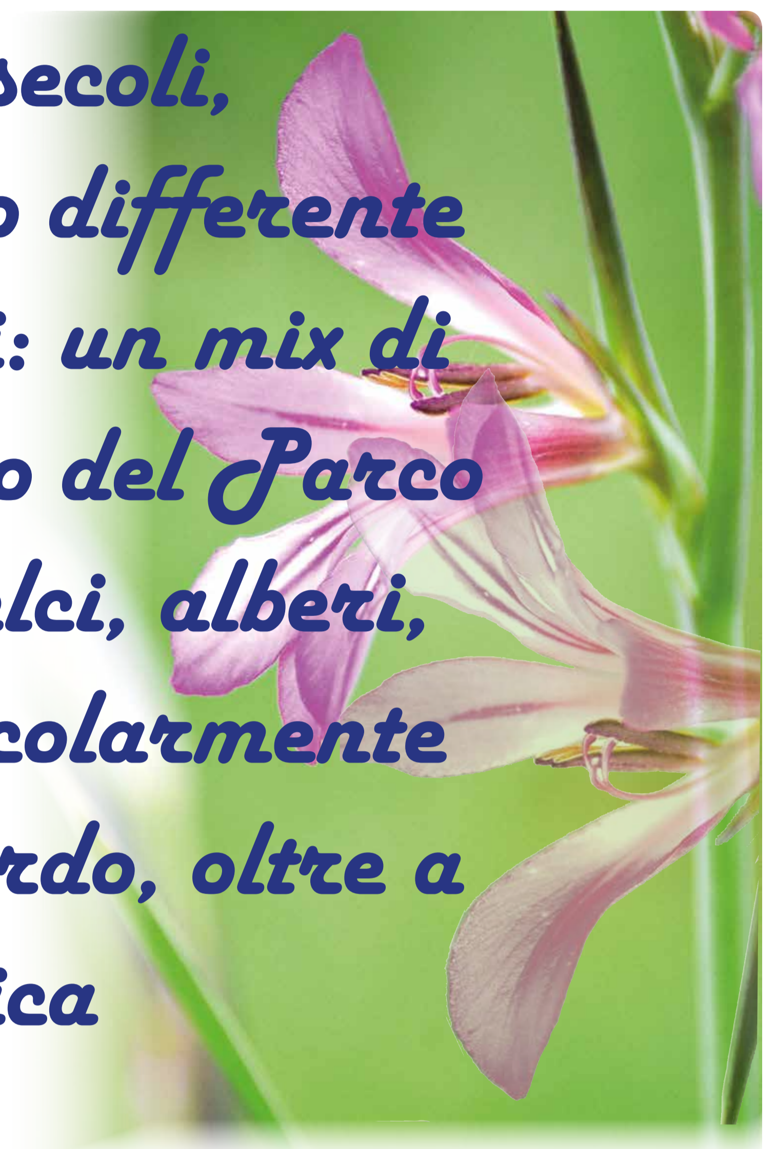
Gladiolo dei campi

Boschi con sottobosco rimasto integro nei secoli, la presenza del torrente Molgora, suoli di tipo differente legati ai diversi periodi glaciali e interglaciali: un mix di fattori che determina la presenza nel territorio del Parco del Molgora di oltre 500 diverse specie tra felci, alberi, arbusti, fiori ed erbe, alcune delle quali particolarmente rare e in via di estinzione nel territorio lombardo, oltre a lembi di vegetazioni dalla valenza unica per l'intera Pianura Padana.