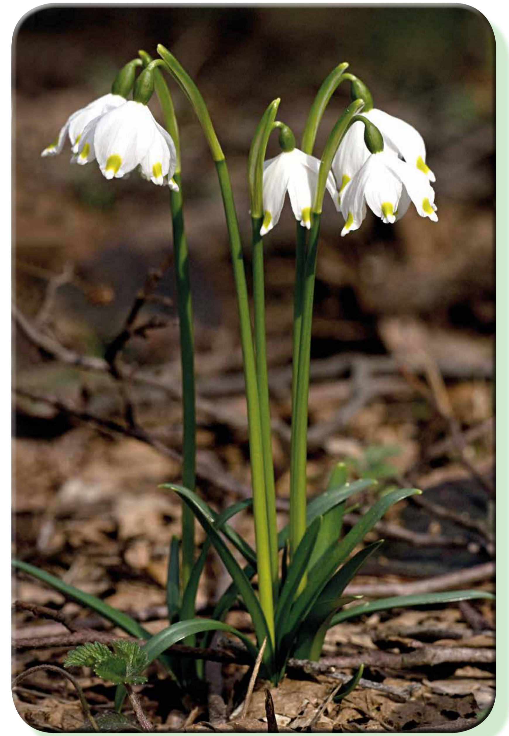
Campanellino di primavera