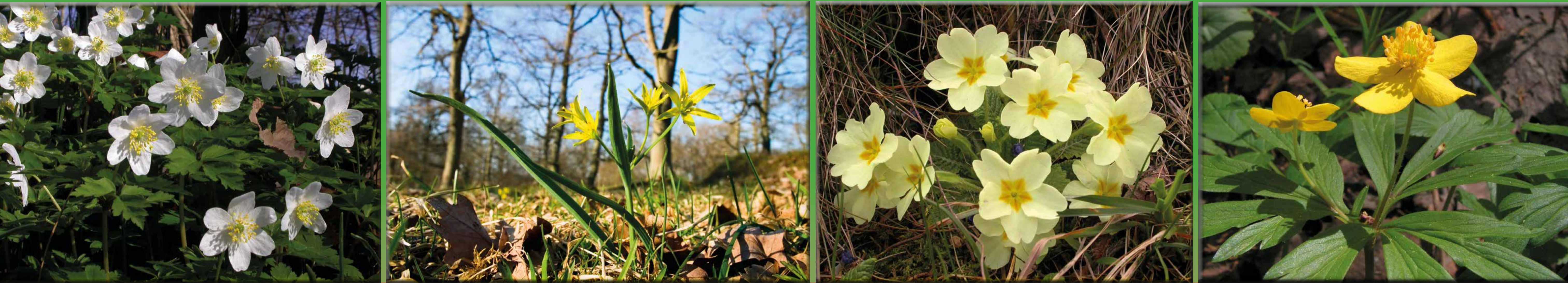
Anemone bianca