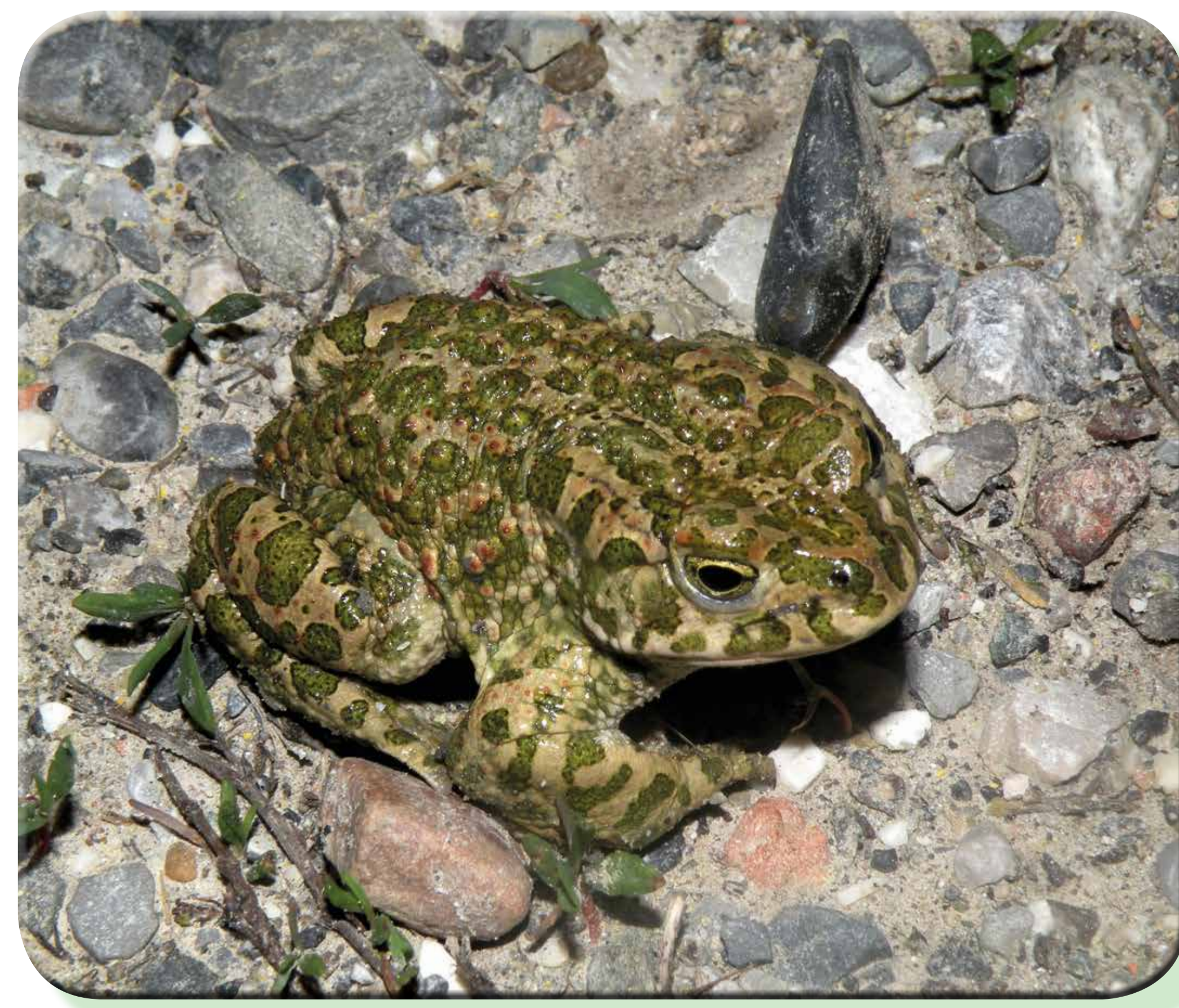
Rospo smeraldino (Bufo viridis)