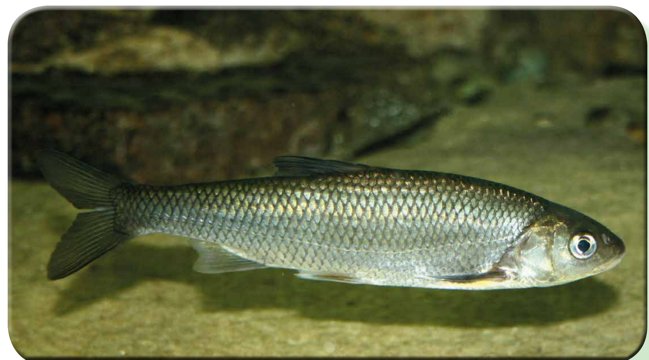
Cavedano italico (Squalius squalus)