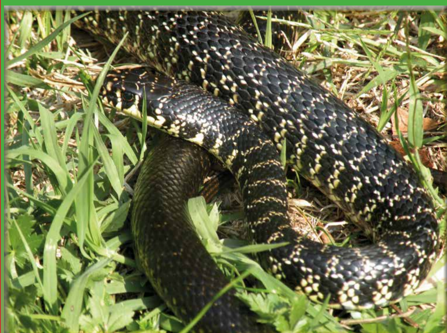
Biacca (Hierophis viridiflavus)