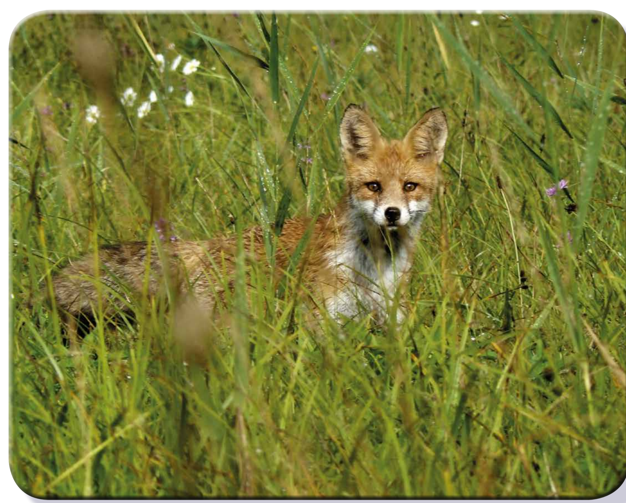
Volpe (Vulpes vulpes)