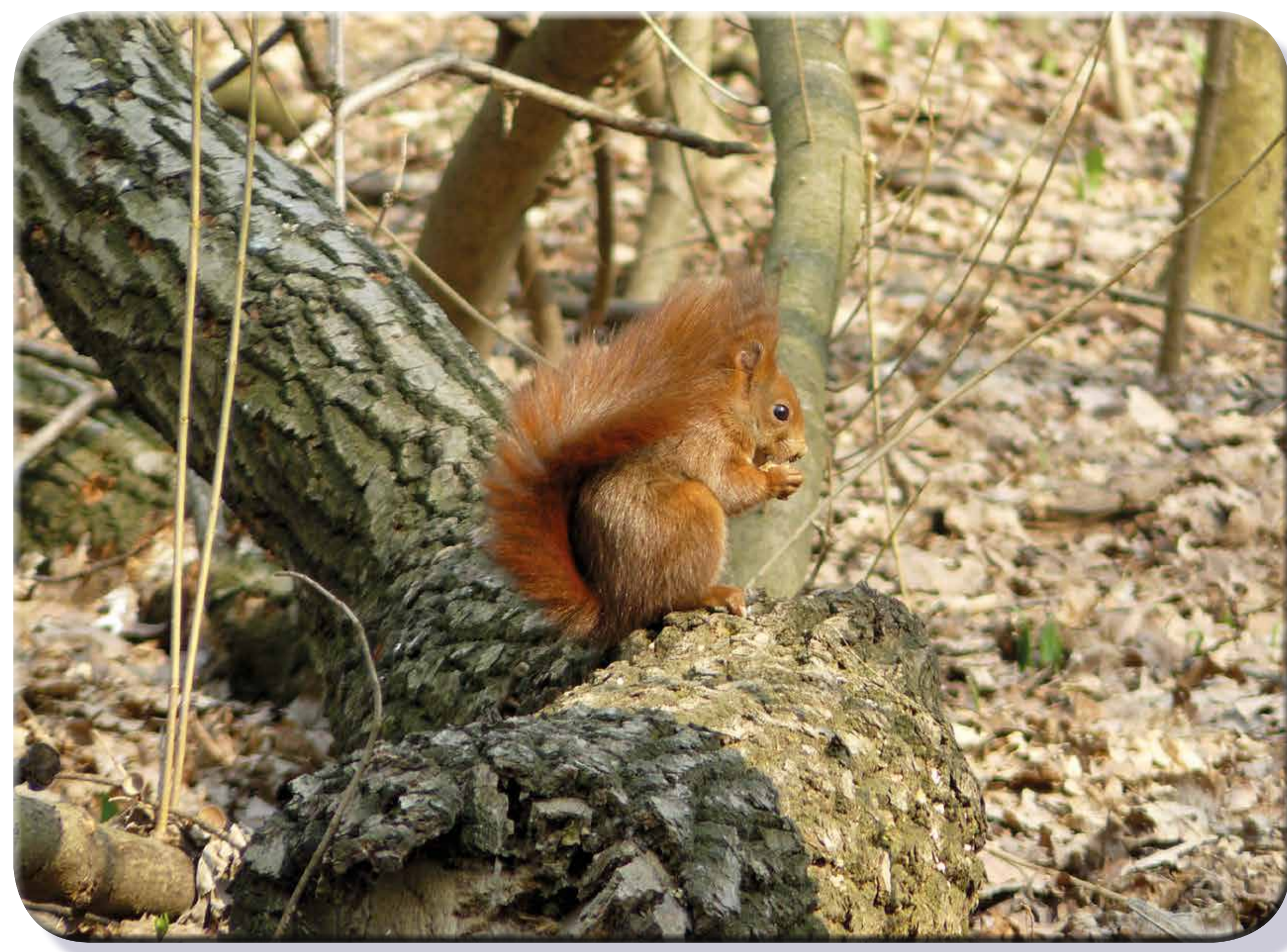
Sciattolo rosso europeo (Sciurus vulgaris) - Foto Claudio Crespi