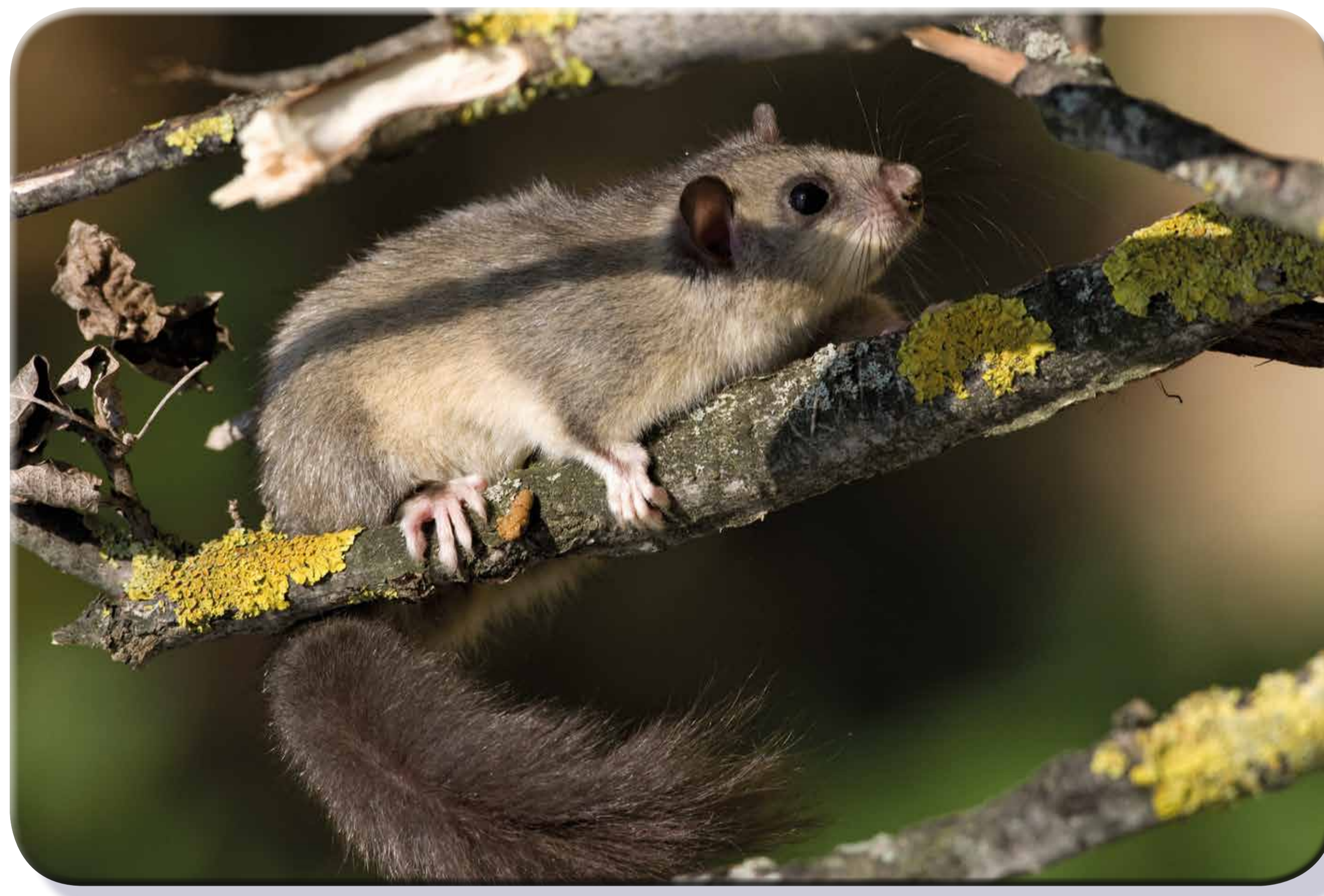
Ghiro (Glis glis)

** categorie di rischio estinzione dell'Unione Internazionale per la Conservazione della Natura. EN = in pericolo, VU = vulnerabile.