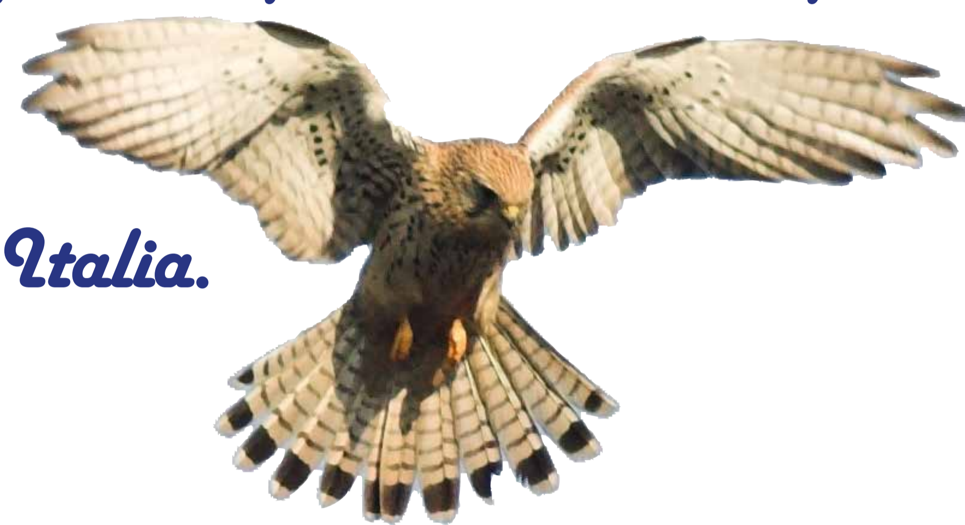
Gheppio (Falco tinnunculus)