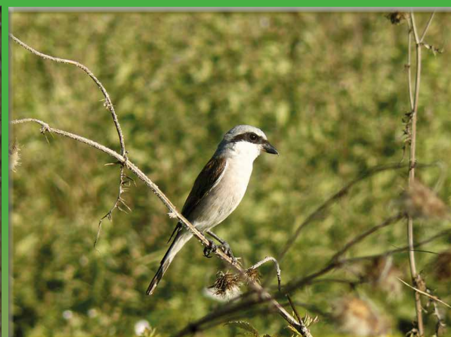
Averla piccola (Lanius collurio)