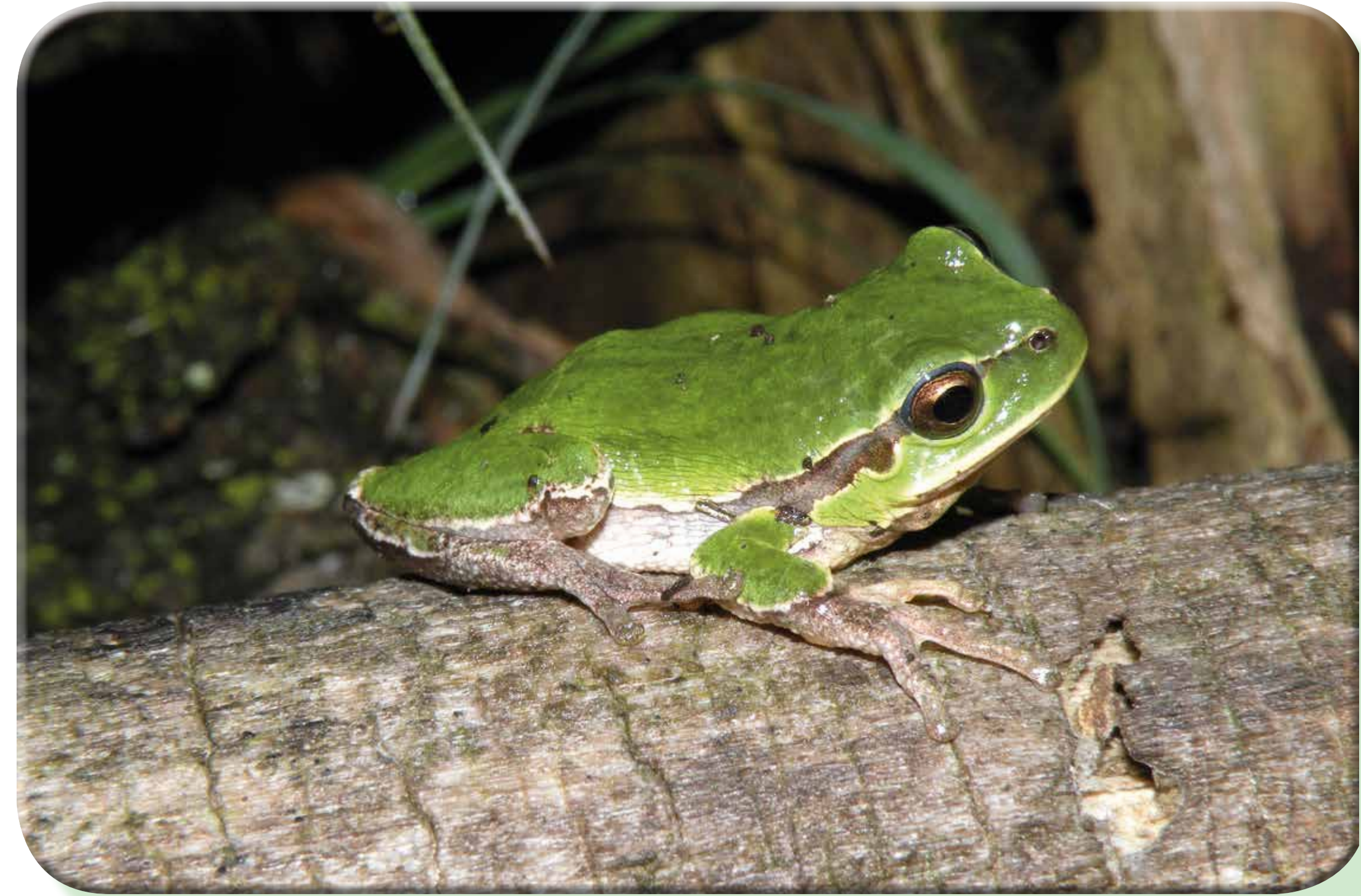
Raganella italiana (Hyla intermedia)