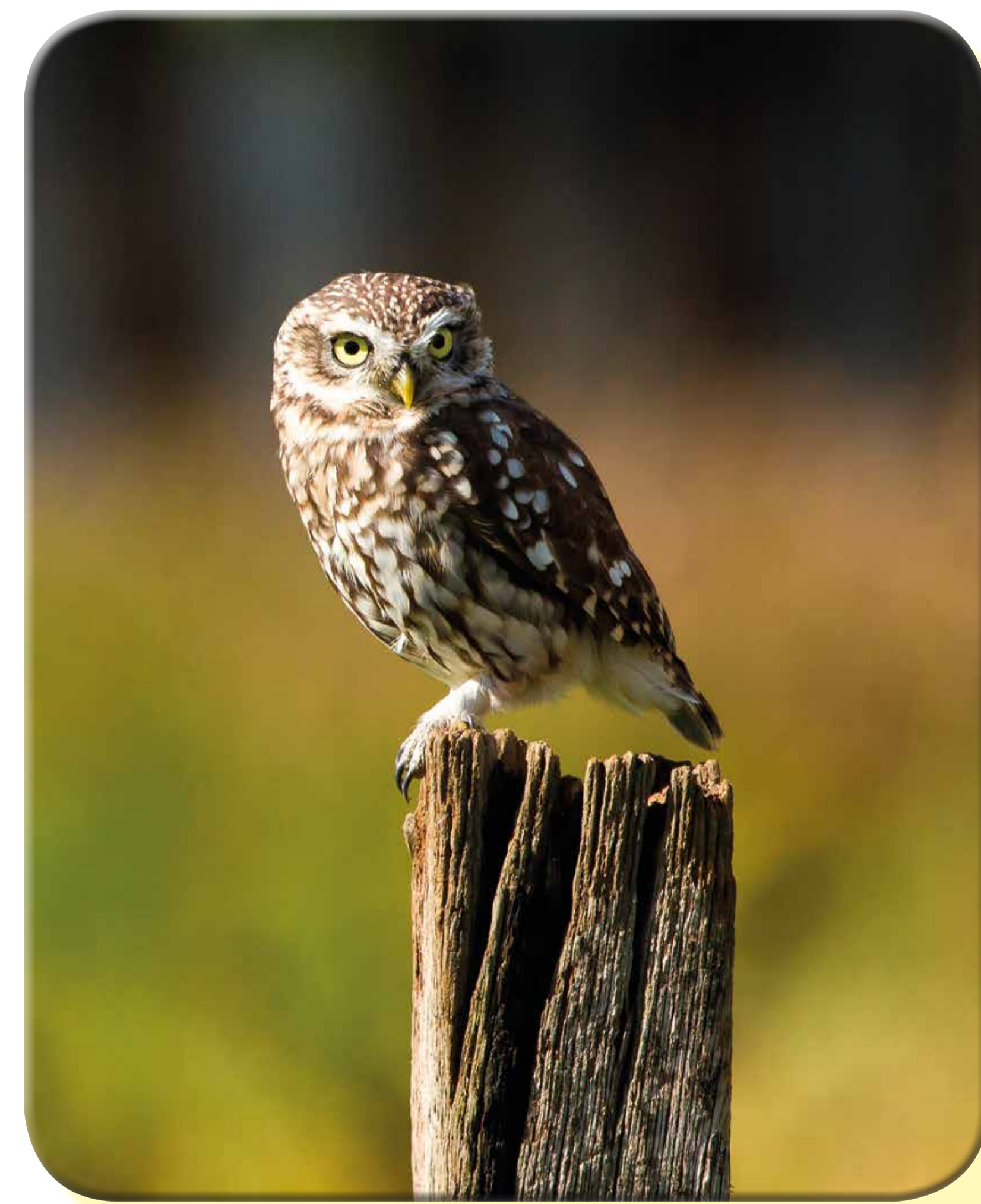
Civetta (Athene noctua)